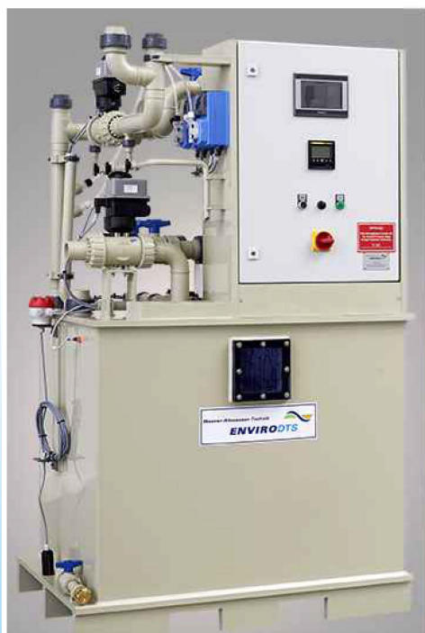
Front- und Seitenansicht Neutro-Fix 3 K